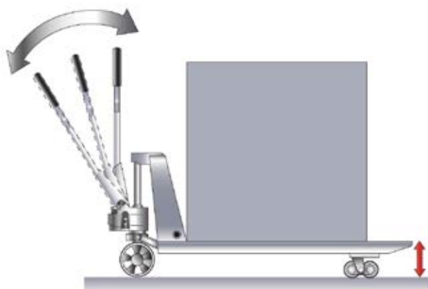
Last durch Pumpbewegungen an der Lenkdeichsel anheben.